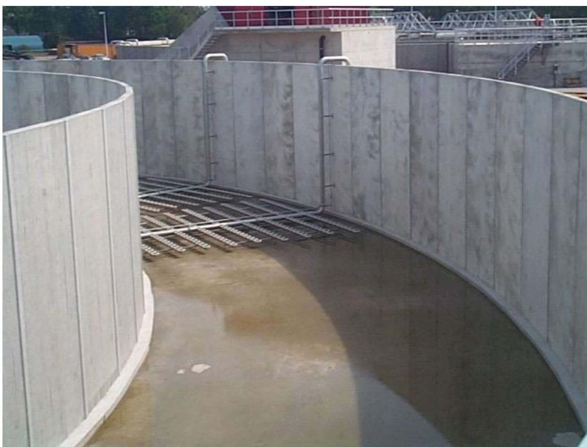
Bestaande beluchtingsystemen; inclusief steunen en leidingwerk te amoveren