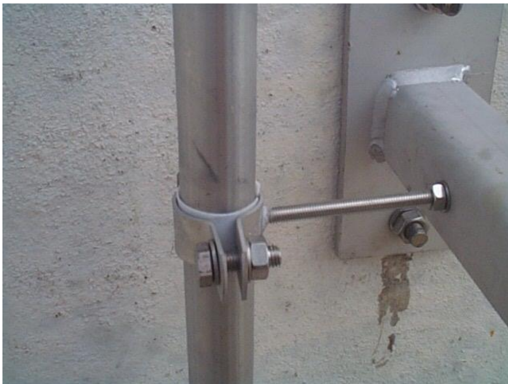
Bestaande beluchtingsystemen; Leidingwerk en steun condensaftap, te amoveren