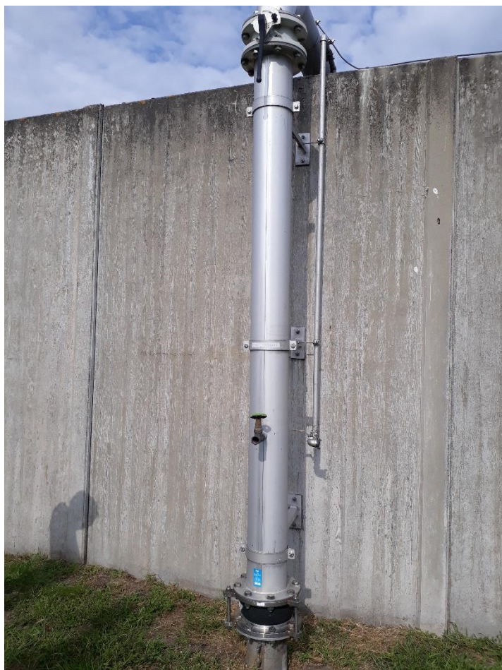
Bestaande stijgleiding; deze vanaf onder compensator vervangen