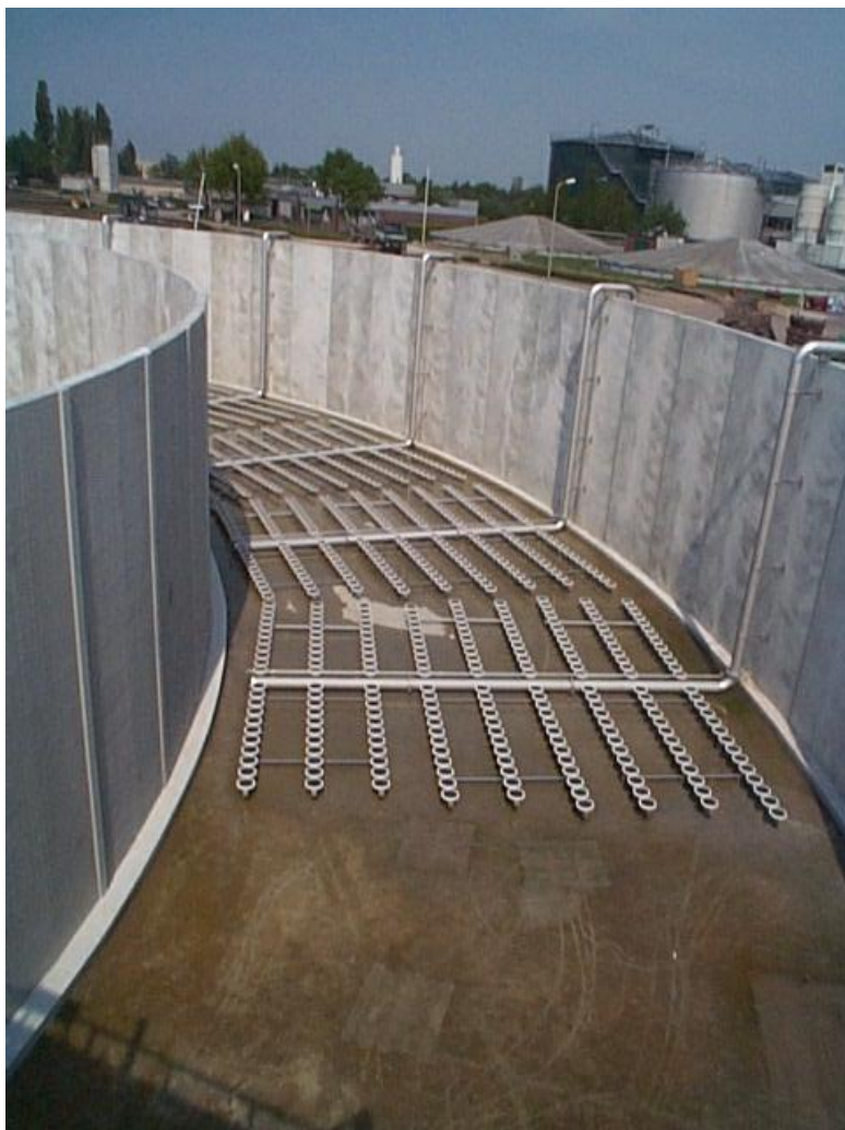
Bestaande beluchtingsystemen; inclusief steunen en leidingwerk te amoveren