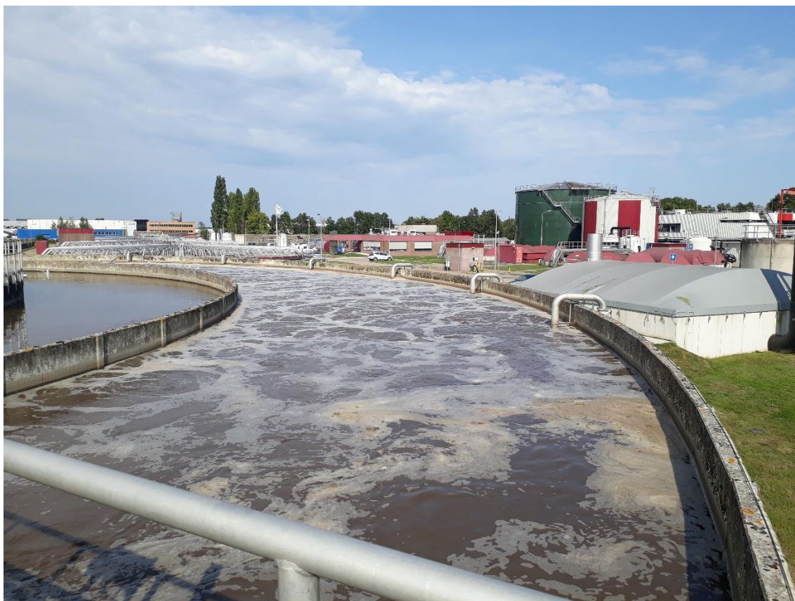
Bestaande beluchting in bedrijf