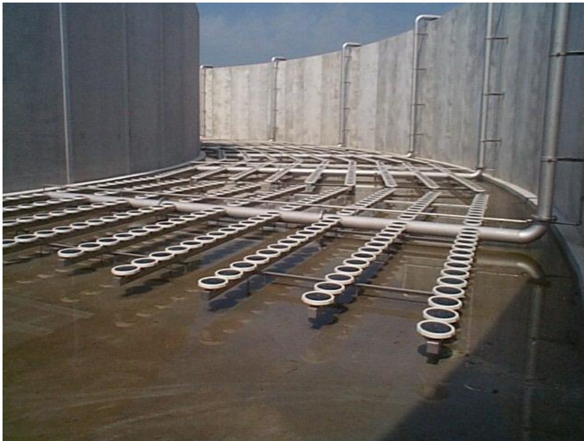
Bestaande beluchtingsystemen; inclusief steunen en leidingwerk te amoveren