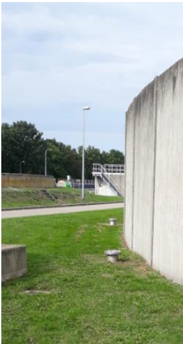
Bestaand leidingwerk; hierop nieuwe stijgleidingen plaatsen